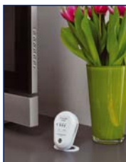
...oder zum Aufstellen